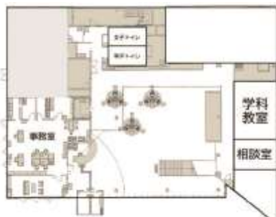
情報センター館内

委託訓練講師(12年) 1名 委託訓練講師(3年) 1名 ジョブカード作成アドバイザー1名 他 2名